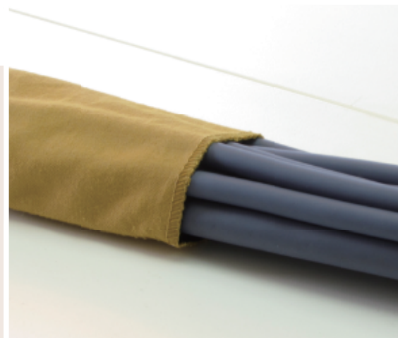
ストロングプロテクター 使用例